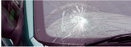
Glace écaillée ou fissurée