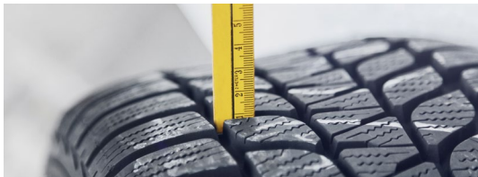
Pneus et roues