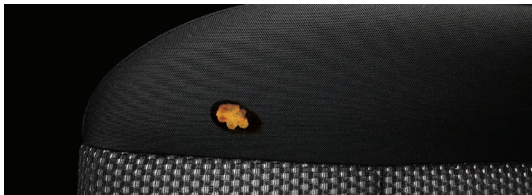
Taches, brûlures et déchirures sur le tissu et le tapis